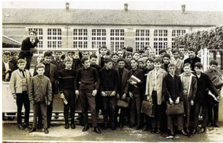
Un groupe de candidats au C.E.P. dans les années 70