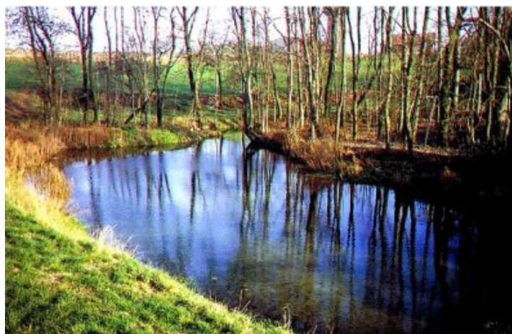
Abreuvoir le long de l'Auve

Aujourd'hui la Champagne s'appelle Â« crayeuse Â» ou Â« sèche Â». On vient de voir ses atouts à propos des problèmes liés à l'eau. Cependant regardez les implantations des villages : ils se serrent les uns contre les autres, le long des rivières, l'Auve, la Bionne, la Tourbe, l'Yèvre, laissant de grands espaces entre elles avec quelques habitats isolés, moins nombreux que par le passé. Mais elle a aussi un problème d'eau. Ici la terre est perméable, c'est un avantage devenant un inconvénient pour maintenir l'eau en surface. Elle ne peut pas être perméable et imperméable à la fois ! Donc l'eau est présente mais il faut aller la chercher dans la nappe phréatique. Pour les besoins humains plus modestes, c'est relativement facile. Mais pour les besoins des animaux, c'est plus compliqué. Pour cela, dans les villages, autrefois, des points d'eau appelés abreuvoirs ont été creusés le long des rivières. Certains villages champenois ont ainsi une rue dite Â« de l'abreuvoir Â» et on remarque encore souvent l'ancien emplacement. Il y a pourtant un étang à Saint-Mard-sur-Auve au sous-sol crayeux. Il se trouve tout simplement au niveau de la nappe phréatique.