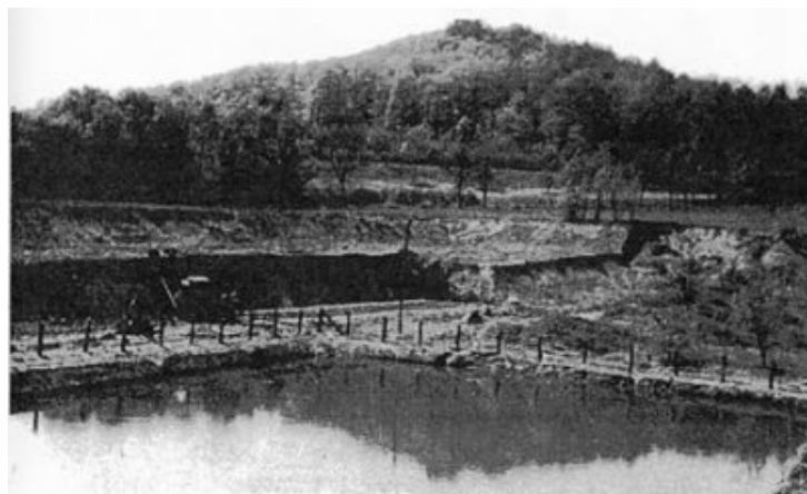
Etang aujourd'hui disparu, comblé par l'usine RVA, après destruction de l'ancienne tuilerie. Dans cette carrière où fut