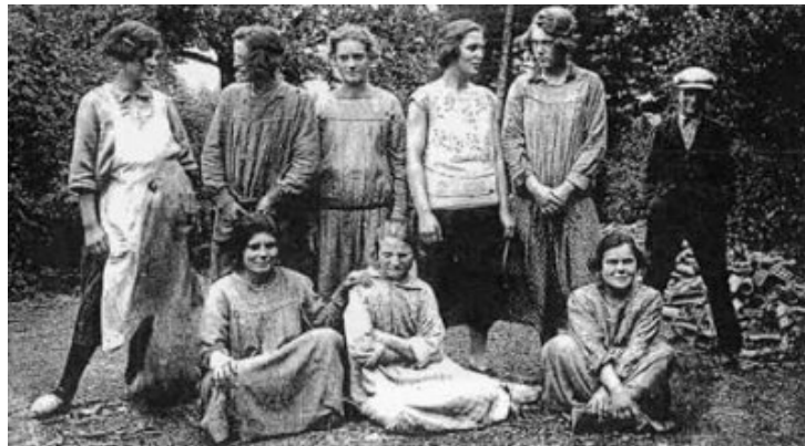
Une partie du personnel, vers 1930, sans doute un jour de Sainte Madeleine