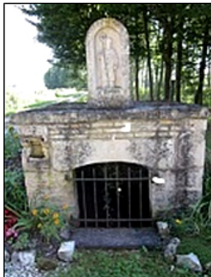
St Claude, Le Chemin

Charmontois-le-Roy : Ste Apolline : fièvre et maux de dents.