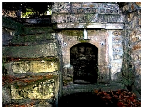
St Didier, Verrières