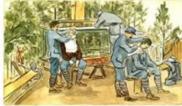
« Le Régiment est prêt à partir de son campement devant Metz. Le régiment d'infanterie de réserve se fait le préparatif... »