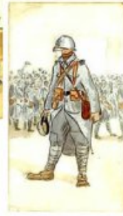
« Le Régiment d'infanterie de réserve se fait le préparatif... »