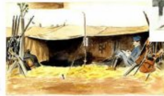
« Le Régiment est installé dans son campement... »