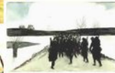
« Marche sur le terrain. (Mars 1870) »