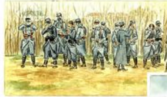
« Exercices sur le terrain. Le régiment de réserve d'infanterie... »