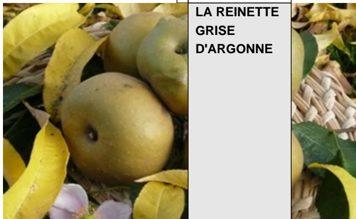
LA REINETTE GRISE D'ARGONNE