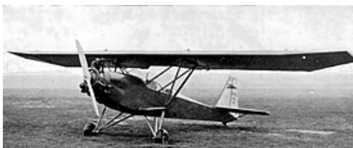
Le Potez 60, premier avion de l'aéro-club

Mais le pays, très bosselé, ne se prête guère aux atterrissages. « J'ai emprunté un compresseur et avec l'aide de quelques camarades et d'une dizaine de prisonniers canaques, nous avons construit dans le fond d'une vallée, deux pistes d'envol permettant de décoller par tous les vents. Puis, nous avons bâti un hangar rustique, couvert de chaume. » , raconte "t-il.