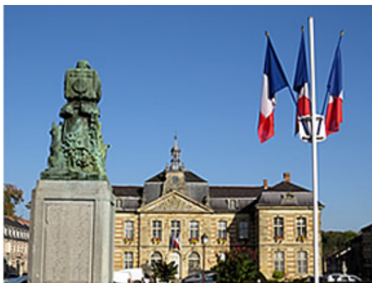
Il regarde l'Hôtel de ville

Il est imposant, magnifique, le monument aux morts de Sainte-Ménéhould, et il fait l'admiration des touristes. Pourtant il a posé bien des problèmes, de financement, de délais et de choix d'emplacement.