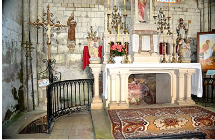
La grotte est située sous l'autel, à gauche l'escalier