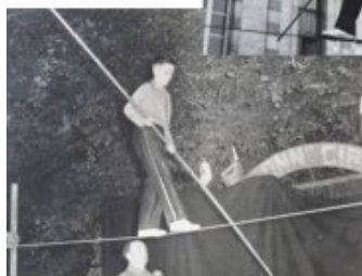
Festival à l'Isle Sainte-Marie