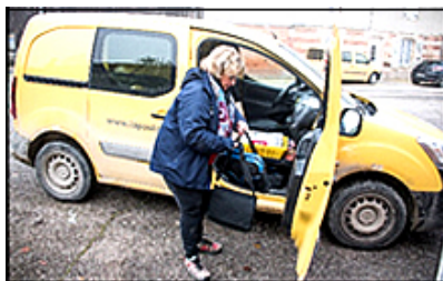
Distribution à La Neuville-au-Pont en 2019

A partir des années 1960, le métier de facteur s'est peu à peu féminisé. Cela correspond, entre autres, à la fin des déplacements à vélo dans les villages. Beaucoup de métiers sont alors dévolus aux hommes. Les femmes sont présentes essentiellement dans l'enseignement, le social, la santé, dans les bureaux et pour les travaux ménagers. Jusqu'à ces années, la plupart des femmes n'ayant pas de profession rémunérée sont dénommées « femmes au foyer » ; et pour leurs papiers personnels elles cochent la case « sans profession » à la colonne demandée. Cela a pu choquer vu la réalité de leurs contraintes journalières, souvent remplies au maximum.