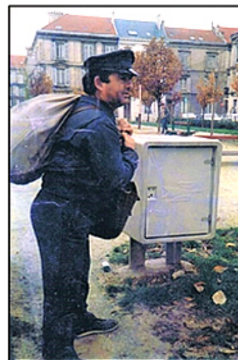
Un facteur argonnais dépose le reste de sa tournée dans un coffre relais à Reims en 1987

Par contre les souvenirs de jeunes facteurs