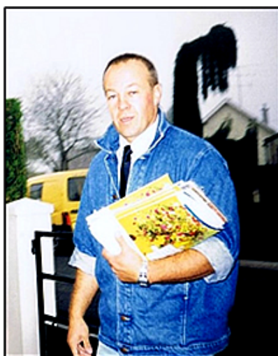
Distribution à Menou au quartier du Romarin

La fin de l'année et les calendriers font bon ménage, surtout dans certaines professions et services. Les facteurs et les pompiers sont en première ligne pour continuer cette agréable tradition.