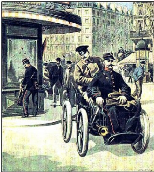
Votre préposé PTT vous offre ses vœux en 1894 Sur un calendrier de 1988 à Verrières.

A ce propos, j'ai entendu plusieurs fois « on a l'air de quémander ». Par contre, dans un village avec sidex, un fidèle du calendrier est obligé de guetter le passage de la factrice qu'il connaît à peine pour pouvoir échanger quelques mots et donner ce qu'il a préparé pour la remercier de ce calendrier.