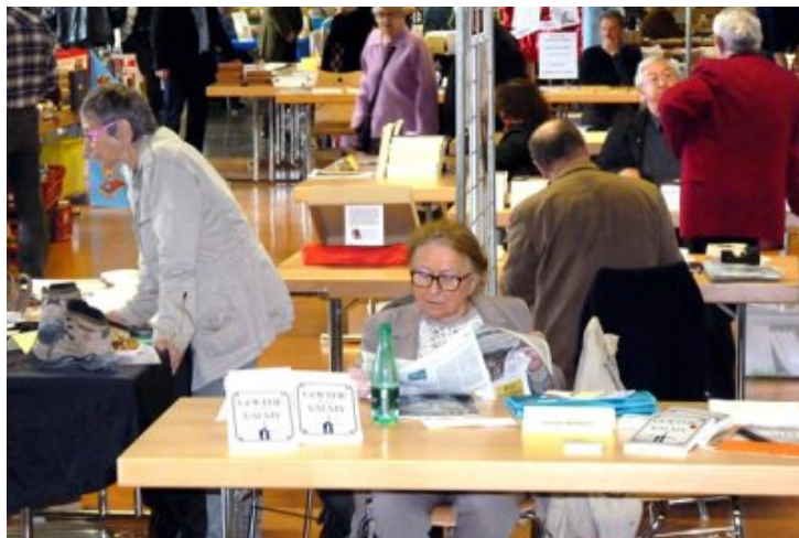
« Goethe jusqu'à Valmy ». class='no-adapt-img' />